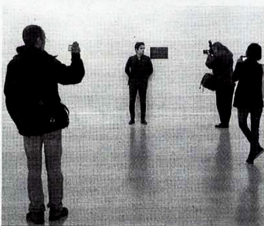
El artista posaba ayer ante los fotografías junto a una de sus miniaturas.

matos realmente diminutos, y eso no resta un ápice a la validez de la propuesta, sino que la exagera", según el comisario.